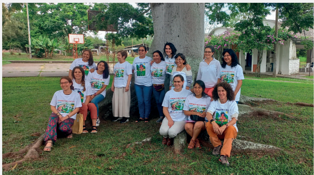
Imagen 6. Participantes del Foro.

A todo eso se añade que fue un placer —y quizás no una casualidad— estar reunidos en Colombia cuando el Congreso colombiano reconoció oficialmente en su Constitución al campesinado como sujeto de derechos y de especial protección.