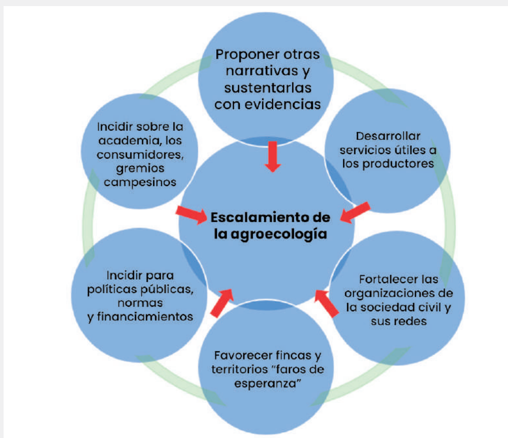
Figura 1: Pilares estratégicos para fomentar la agroecología. (Elaboración propia)

Un objetivo clave del Foro era reflexionar sobre las estrategias y palancas por activar para favorecer el escalonamiento de la agroecología. Los aportes y debates fueron numerosos y es difícil rescatarlos por separado. Sin embargo, proponemos agrupar sus ideas principales en seis pilares estratégicos (Figura 1).